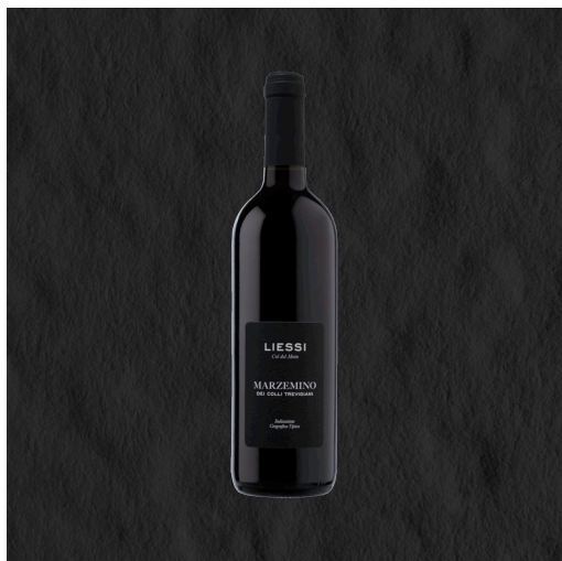
Marzemino DEI COLLI TREVIGIANI

Vino rosso, dal colore rubino intenso, sentori fruttati e gusto sapido, abbastanza tannico e secco.